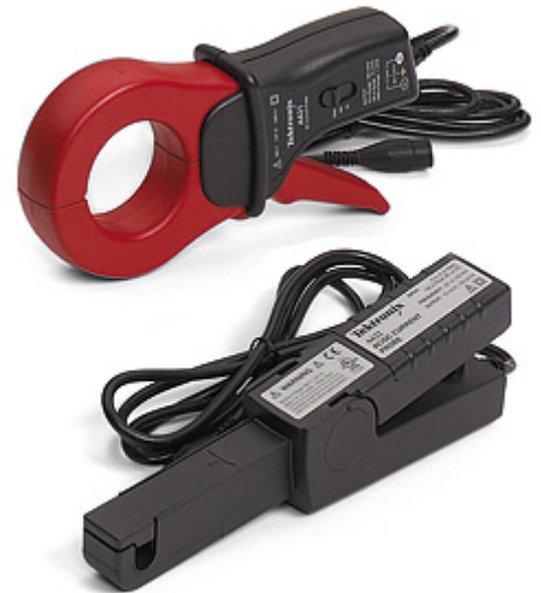
Nota: Sondas de corriente tradicionales.

Las sondas generalmente ofrecen un método mecánico para abrir el lazo del circuito magnético para permitir insertar el cable conductor.. La posición del conductor dentro del lazo tiene relativamente poco efecto sobre la medida.